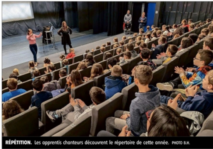
RÉPÉTITION. Les apprentis chanteurs découvrent le répertoire de cette année.

Dans la grande salle de l'auditorium Sophie-Dessus d'Uzerche, les écoliers et collégiens d'Uzerche ne donnent pas tous de la voix, par timidité sans doute, mais la matinée durant, ils restent concentrés. Lundi, c'était jour de rentrée pour le programme Sing'In Corrèze, porté par le Festival de la Vézère avec la Fondation