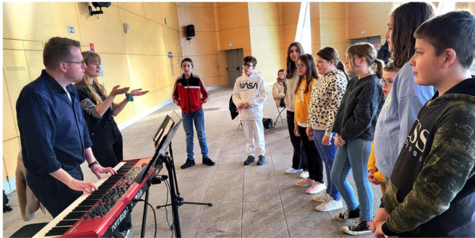
Une première répétition dans la bonne humeur.

Pour la saison 2024, plusieurs établissements scolaires ayant participé au projet 2023 ont souhaité poursuivre l'aventure SING'IN, à savoir, pour Calais : le collège Les Dentelliers (classe CHAM regroupant des élèves de la 6 e à la 3 e ), le collège Vauban (REP+ avec 2 classes, 6 e et 5 e , de la section internationale britannique), et le collège Martin-Luther-King (REP+ avec sa chorale). Ajoutons le collège Louis-Biériot de Sangatte, avec sa chorale, et le collège Jean-Rostand de Marquise avec une classe de 6 e . Au total, ce sont 150 collégiens et collégiennes, de tous les niveaux de classe, issus du Calaisis et du Bou-